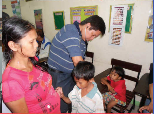
District Relief Donation, San Mateo Rizal, Aug. 21, 2013