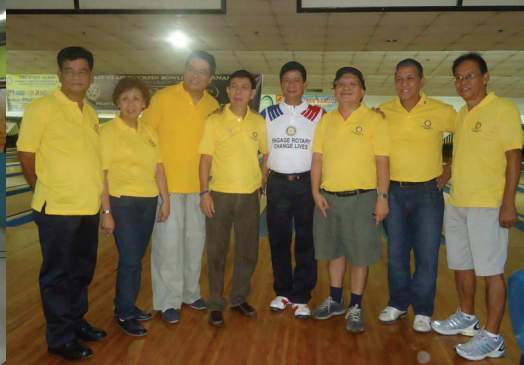
RC Rizal Centro, RC Antipolo City and RC Rizal MidEast Inductions, Aug. 9, 2013