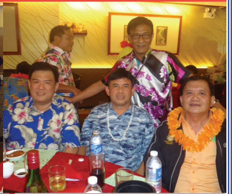
District Membership Committee Meeting, Aug. 14, 2013