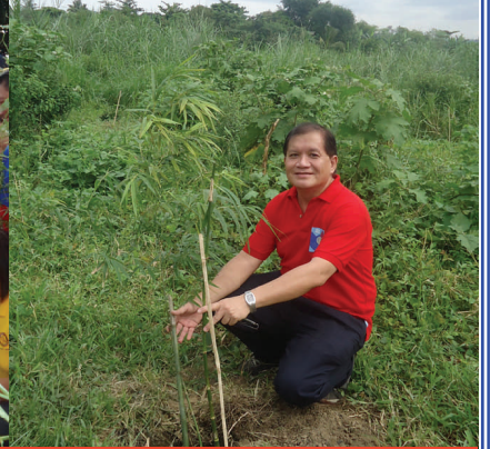
RC Pasig Central Induction, Aug. 13, 2013